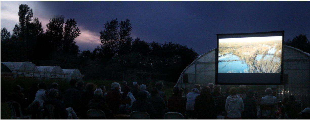
Un météo clémente et un environnement en résonance avec le film